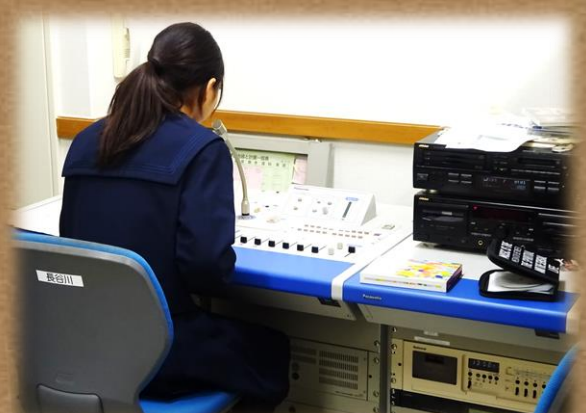
いじめ撲滅作文を全校放送