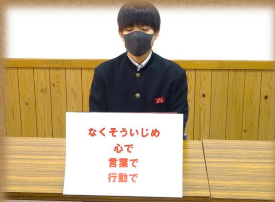
生徒会長による3か条発表